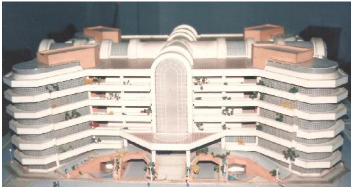
Proyecto Arq. Guillermo Prada O.

Plaza de mercado central, Plaza de San Francisco, Plaza de mercado Guarín, Plaza de de mercado La Concordia, Plaza de mercado Satélite, Plaza del barrio Kennedy, Mercado Campesino Ciudadela.