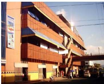
Sanandresito - original

Encontramos un común denominador en todas las plazas: La inseguridad, el caos la delincuencia, la falta de inversión en mantenimiento y remodelación de infraestructura en los centros de abasto, las ventas ambulantes alrededor de las plazas, son los factores que afectan de forma negativa. El problema es que en todos los centros comerciales y plazas, muchos puestos están vacíos porque ellos mismos deciden trabajar en la calle de igual manera, una de las soluciones está en que los inquilinos pasen a ser propietarios de los locales comerciales en las plazas. De esta forma ellos se pueden apropiarse y organizarse para hacer las inversiones necesarias para la renovación de las infraestructuras, y estarían más atentas al cuidado e higiene de las mismas de forma eficiente, e invirtiendo en proyectos significativos en los que estos puedan competir con los almacenes de cadena que arribaron a la ciudad en forma masiva. Un buen ejemplo lo fue en su momento la salida de los comerciantes del parque Centenario mas conocidos como “Sanandresitos” se organizaron y se establecieron legalmente en un edificio que ha mejorado atreves del tiempo compitiendo con los demás centros comerciales de la ciudad.