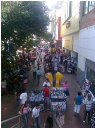
Lo informal & lo legal

Sociedad Colombiana de Arquitectos Regional Santander Informativo virtual N° 110