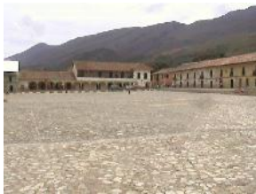
Plaza de Villa de Leiva

Los mercados comenzaron en las plazas públicas de los pueblos originales de la colonia, se hacían cada domingo y eran sitio obligado de reunión ya que allí se concentraba el comercio y toda la actividad social, venían gentes al pueblo de todas las partes cercanas y lejanas a realizar el trueque como el tradicional mercado.