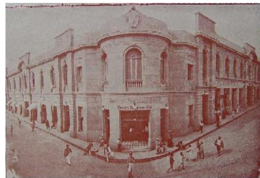
Plaza Pabellón de mercado San Mateo (archivo Eslava y gavaza)

El lugar donde se construyó la Cada de Mercado era anteriormente una laguna llama “San Mateo”. El nombre de San Mateo tuvo su origen en una laguna que había en el sector cuando llegaron los españoles quienes la bautizaron como de “Los Caracoles” por la profusión de estos animales. Posteriormente la fuente se empezó a secar, pero la tradición popular recordaba que cuando llovía la laguna se desbordaba, lo que motivo que la población comprara una estatuilla de San Mateo para conjurar el peligro.” (Tomado del libro crónicas de Bucaramanga, p. 135) A mediados del siglo XIX, la manzana donde había estado ubicada la laguna, ya no tenía rastros de ella y aún no había sido construida.