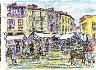
Pintura del mercado

Una plaza es un espacio urbano público, amplio y descubierto, en el que se suelen realizar gran variedad de actividades. Las hay de múltiples formas y tamaños, y construidas en todas las épocas, pero no hay ciudad en el mundo que no cuente con una. Por su relevancia y vitalidad dentro de la estructura de una ciudad se las considera como salones urbanos. En el siglo XX se trasladaron esos sitios de mercado a edificios cubiertos en los que se les alquilaban puestos a los vendedores de productos los cuales los clasificaban por actividad fama, toldo, frutas etc. Cualquier plaza donde se celebra mercado, tanto si es abierta como si es cubierta (la tendencia a cubrir las plazas abiertas de mercado respondía a los ideales higienistas del siglo XIX, y desarrolló una particular arquitectura utilizando las nuevas posibilidades de la arquitectura del hierro). El concepto no se aplica tanto al nuevo concepto de centro comercial, propio de finales de siglo XX y comienzos del XXI. El concepto económico, geográfico, sociológico o antropológico de lugar de mercado (muy utilizado también directamente en inglés: marketplace), por oposición al principio de mercado en economía (market principle) o leyes del mercado en un mercado puro o teórico sin necesidad de existencia real (el modelo ideal que supone el libre juego de la ley de oferta y demanda sin restricciones de ningún tipo).