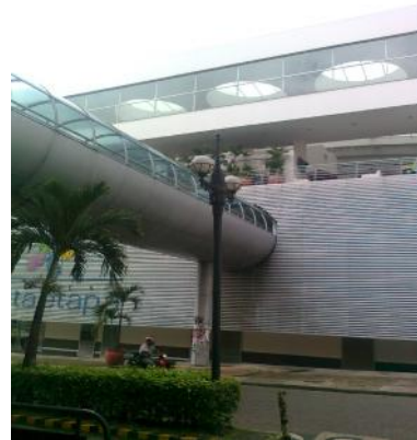
CCC 4 Etapa