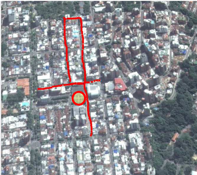
Propuesta de la SCA año 2010 - Peatonal