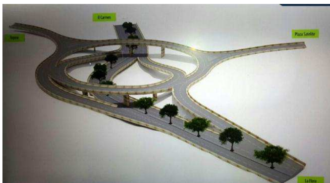
Intercambiador vial de Fátima Avenida 60 entre calles 107 – 108 Floridablanca, Transversal oriental metropolitana

Nuestro compromiso tiene en el reconocimiento institucional que nos da el estado en materia de concursos de arquitectura decreto 2326/95 , anexo a la ley 80, como único ente consultivo del gobierno en materia de selección de propuestas en donde la asesoría calificada de la SCA responde en su coordinación por un secretariado que va desde la preparación de la investigación preliminar, programa arquitectónico, bases del