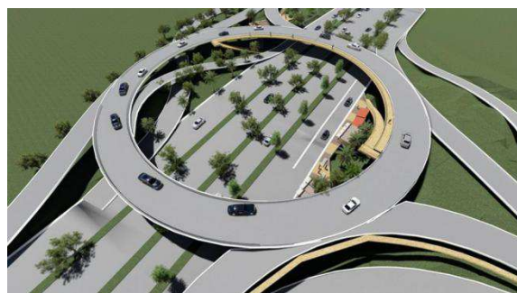
Intercambiador vial de “PQP” - calle 200 con autopista Floridablanca - Bucaramanga