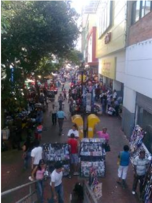
Lo informal & lo legal

Sociedad Colombiana de Arquitectos Regional Santander Informativo virtual N° 110